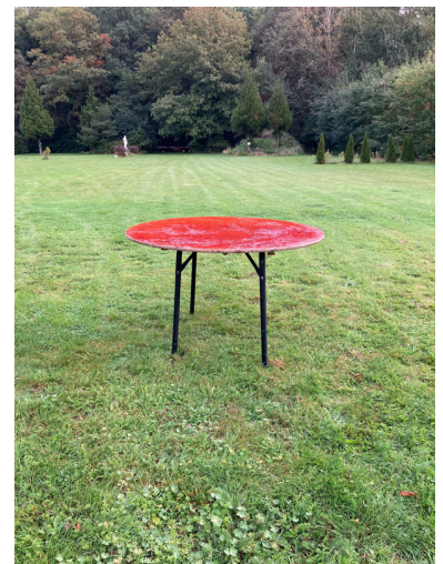
1x120 cm voor 4 pers. 2x150 cm voor 6 pers. 1x180 cm voor 8 pers.