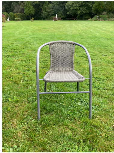
40 Griuze stoelen