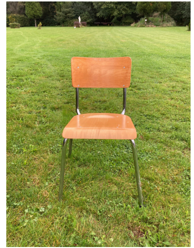
18 School stoelen