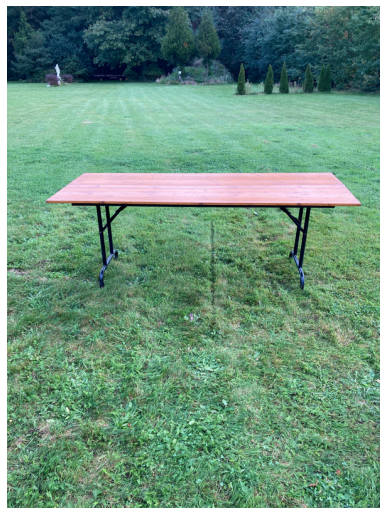
3 Tafels voor 8 pers. 200x80 cm