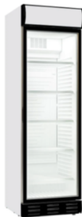
2 grote drankkoelkasten