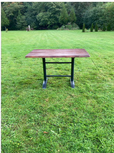
5 Tafels voor 4 pers. 120x70 cm