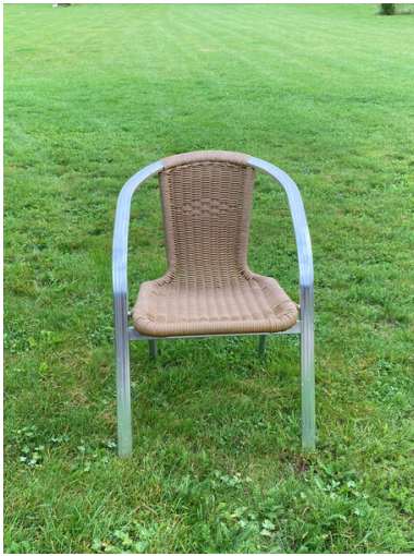
28 Bruine stoelen